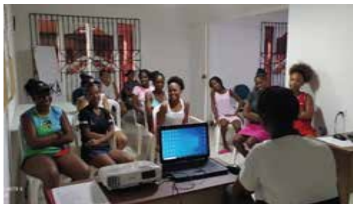
Salud sexual y reproductiva 3. Charla de sensibilización