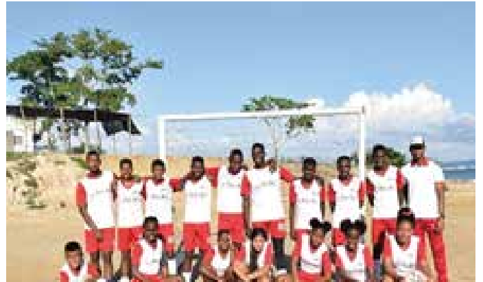
FFC 2. Jornada de futbol por la paz (FPLP)