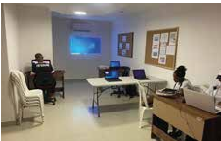
Habilidades para la vida 5. Espacio de trabajo