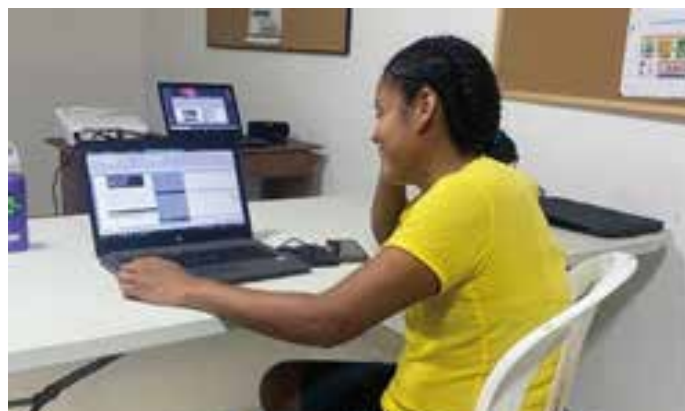
Habilidades para la vida 2. Grupo de padres