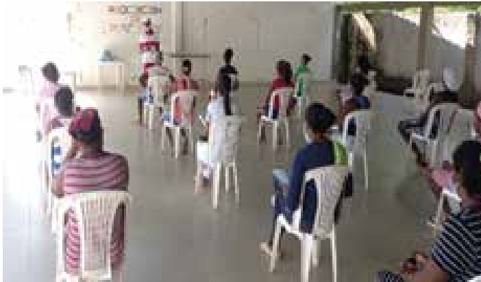
FFC 1. Escuela para padres EPP