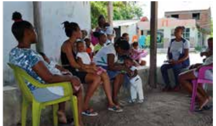
NUTRIARKA 2. Vínculos afectivos