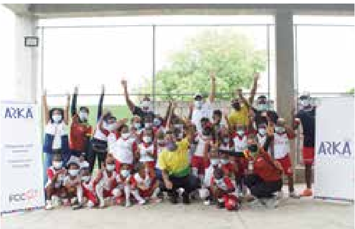
FFC 5. Encuentro IDER