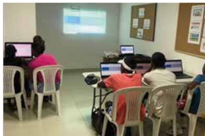
Habilidades para la vida 6. Ejemplo programas