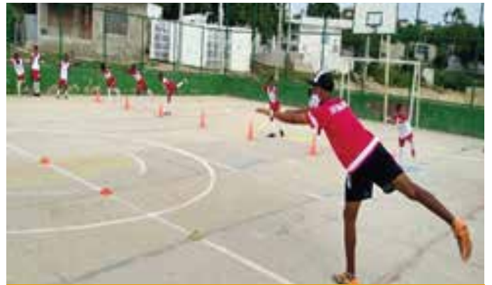
FFC 4. Entrenamientos creadores