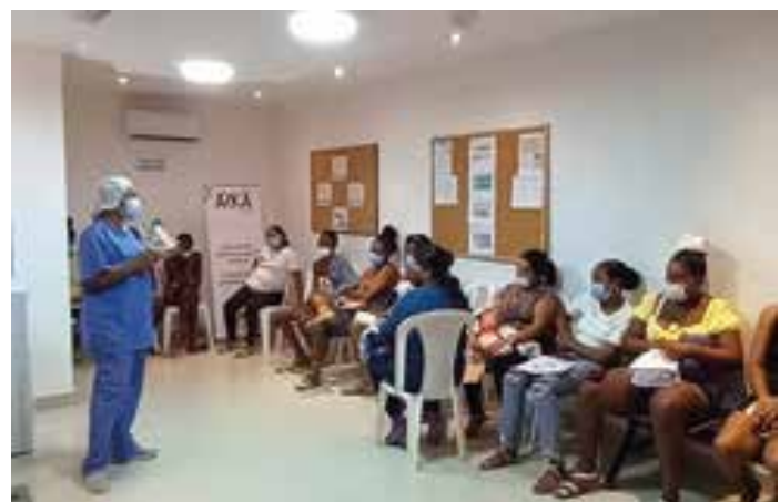
Salud sexual y reproductiva 5. Charla informativa jornada de implantes