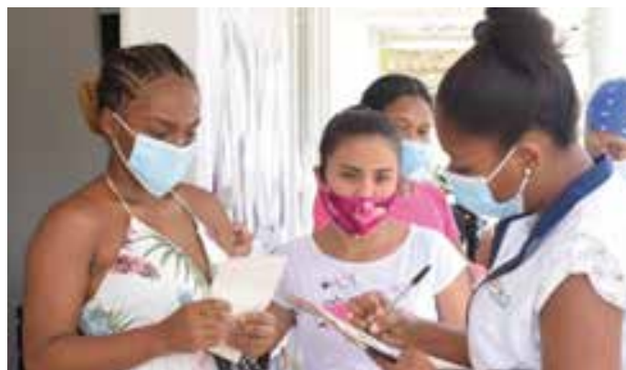
Salud sexual y reproductiva 2. Toma de datos