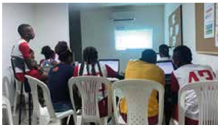
Habilidades para la vida 3. Encuentros presenciales