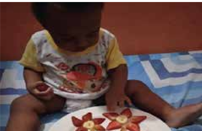
NUTRIARKA 5. Educación nutricional