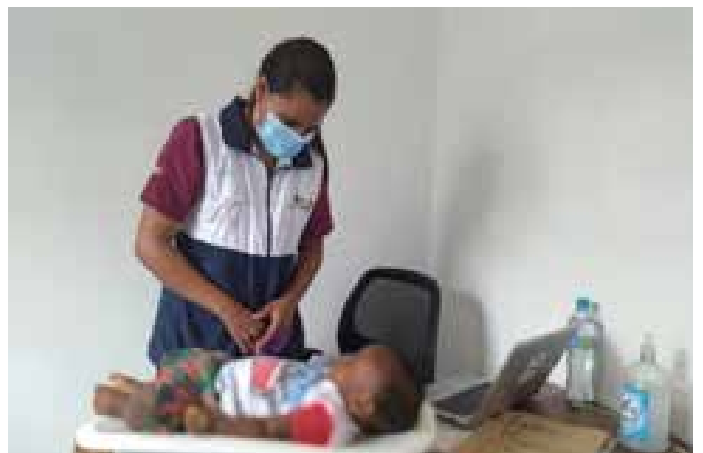
NUTRIARKA 6. Atención nutricional