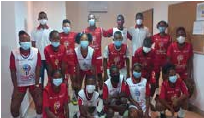
FFC 3. Copa claro por Colombia