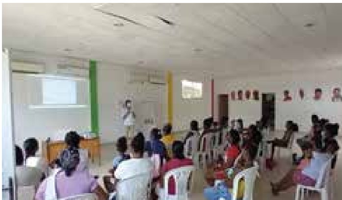
NUTRIARKA 3. Charla psicosocial