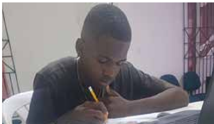
Habilidades para la vida 1. Ejemplo metodología