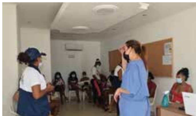
Salud sexual y reproductiva 3. Charla informativa jornada de implantes