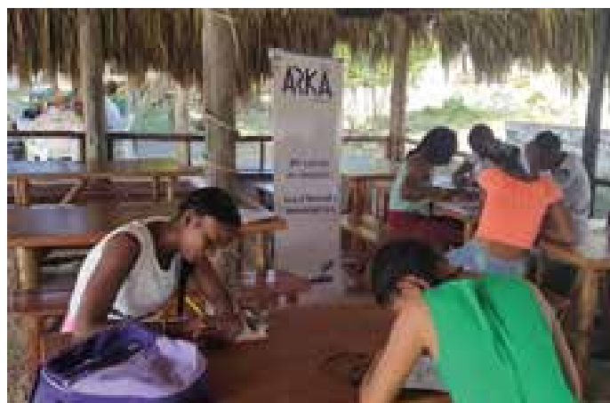
Salud sexual y reproductiva 6. Proyecto de vida