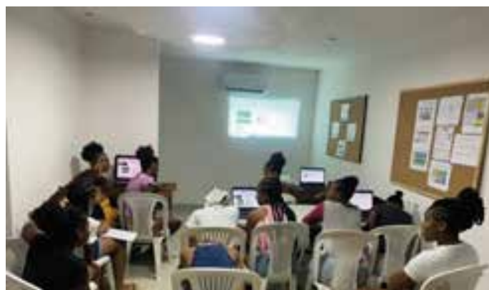
Habilidades para la vida 4. Encuentros presenciales