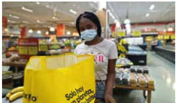
NUTRIARKA 4. Entrega de complementos éxito