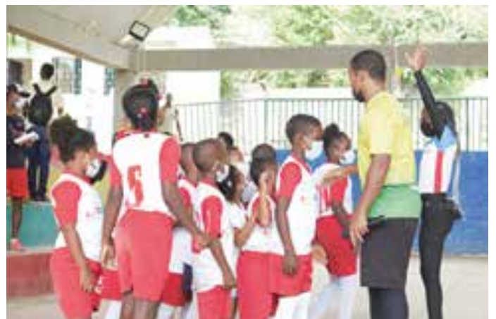
FFC 6. Encuentro IDER