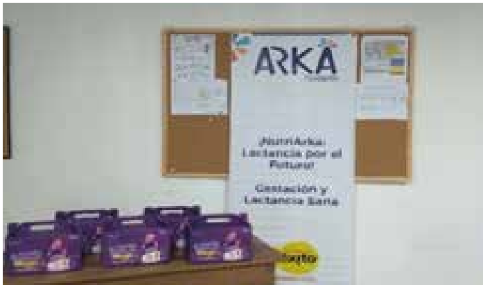
NUTRIARKA 1. Vínculos afectivos